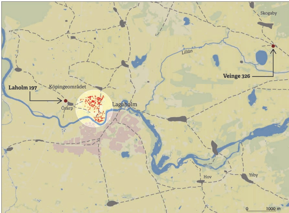
Figur 7. Laholmsområdet med historiska vägnät, byar och platser omnämnda i texten. Vid Lagaholm och Ösarp syns spridningen av metalldetektorfynden (röda prickar) från den troliga anlöps- och handelsplatsen vid Köpinge. Gården Furudal i Skogaby (RAÅ Veinge 326) har haft goda möjligheter till kommunikation längs väglederna, men även vattenvägen över Skogabysjön och via Lillån ner mot Lagaholm.

halländsk bebyggelse genom sina kontaktytor, där handel, hantverk och specialiserad produktion kan ha varit en viktig del. Ett undantag är det fyndrika Köpingsområdet vid Laholm som bör ha goda förutsättningar för vidare forskningsinsatser, inte minst utifrån projektet Lahund:s goda resultat från omfattande metalldetekteringar. Ett rikt material från vendel- och vikingatid pekar på en anlöpsplats intill Lagan, samt ett intilliggande marknads- och hantverksområde och gravfält (Bjuggner et al 2010:65ff).