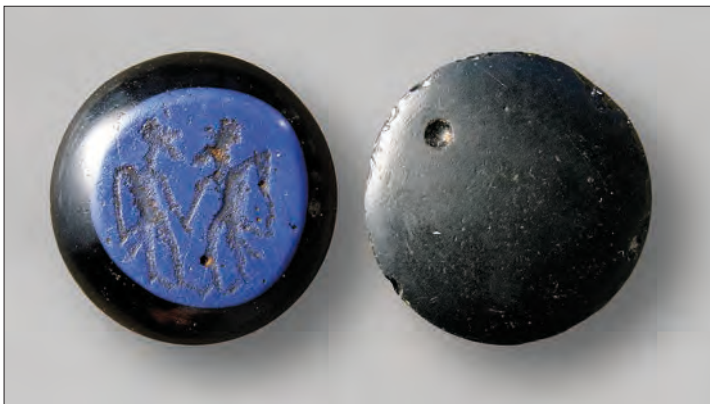
Figur 1. Alsengemen från lokalen Furudal i Skogaby.

Ett udda inslag i den materiella kulturen från den tidigmedeltida lokalen Furudal är en alsengem, som endast påträffats i några få exemplar i Skandinavien. I artikeln diskuteras hur den hamnat i den halländska myllan, samt innebörden av smyckets ristade motiv. Här förespråkas en tolkning där alsengemen ses som ett buret emblem, en gruppmarkör för ett handelsnätverk med förgreningar ner på den tyskspråkiga kontinenten. Köpingsområdet i Laholm uppvisar ett antal importfynd från samma område och ska säkerligen inräknas i detta långväga nätverk.