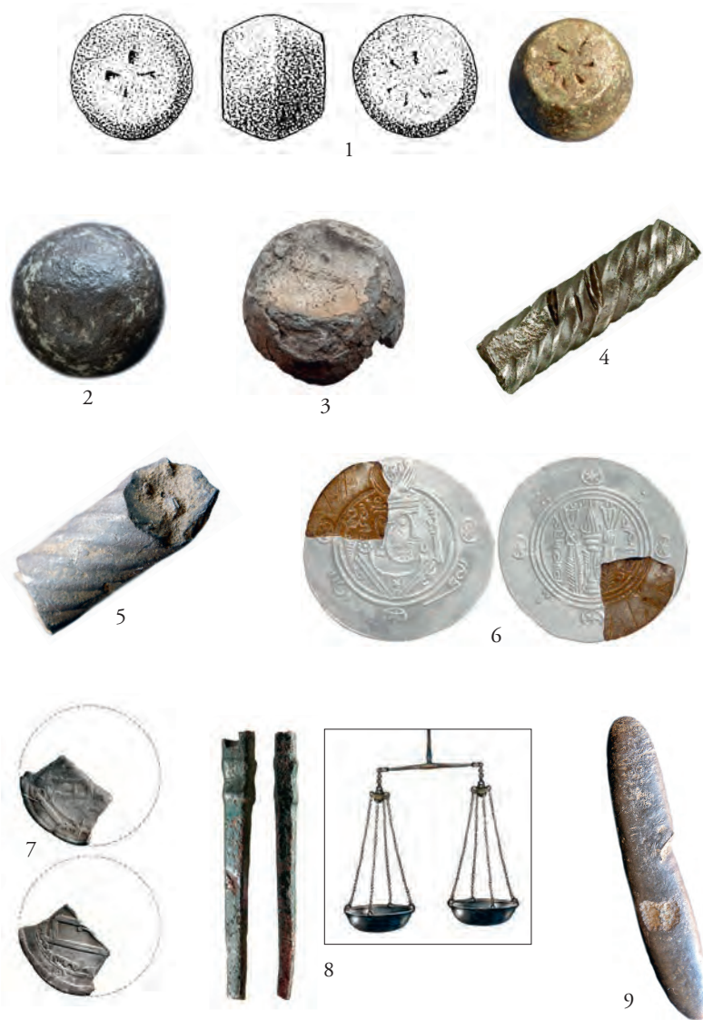
Figur 6. Metalldetektorfynd från Köpingeområdet i Laholm som indikerar att en vendel- och vikingatida handelsplats legat i området (ej i skala).