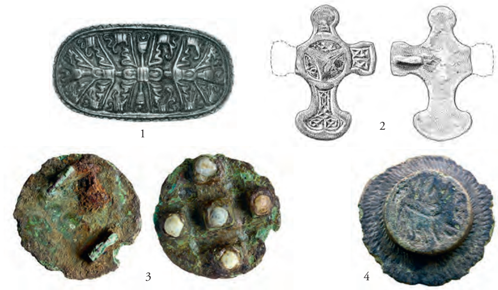
Figur 8. Exempel på importerade metallsmcken:

Ytterligare föremål från Laholmsområdet är de senvikingatida och tidigmedeltida karolingisk-ottonska spännena, som återfunnits vid Köpingsområdet samt storgårdarna i Ösarp och Furudal. Från Köpings finns ett massivt spänne med upphöjt mittparti och snedstrierat brätte. Det stiliserade tillbakablickande djuret symboliserar ett lamm och är ett Agnus Dei-motiv. Kvalitetsmässigt tillhör spännet en enklare serieproduktion. Till en mer kvalitetsfull serieproduktion hör spännet från Ösarp. Smycket är påträffat i