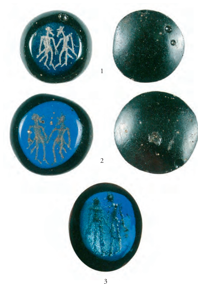
Figur 3. Alsengemmer av typ II från Uppland, Sigtuna (1-2) samt Skåne, Bunkeflo bytomt(3), Efter Roslund 2009:229. Skala 2:1.

den andra. Fem av dem är hittade vid urbana orter som Ribe, Lund, Kalmar och Sigtuna. De är också påträffade på landsbygden, vid Furudal, samt vid en medeltida gård i byn Bunkeflo utanför Malmö, som under högmedeltid stod i kyrklig ägo (Selling 1948; Mårtensson 1967; Lövgren et al 2007; Roslund 2009; van Vilsteren 2014).