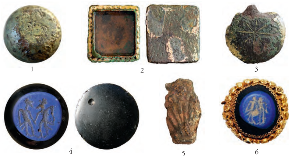
Figur 4. Några av de tidigmedeltida metallföremålen från lokalen Furudal i Skogaby, samt en alsengem från Blije i Nederländerna. Föremålen utmärker sig jämfört med fynd från andra halländska gårdar vid denna tid, och visar på visst välstånd och långväga kontakter.

Vilka sociala grupper som utförde kostsamma pilgrimsresor vid denna tid är osäkert men de bör ha varit knutna till en maktburen miljö med personer från höga sakrala och profana skikt. Ett fynd som kan tala för en sådan tolkning är alsengemmen från Bunkeflo, som troligen ska förknippas med en större gård i kyrklig ägo. Denna gårds sociala status under